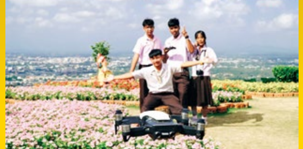
บรรยากาศการเรียนถ่ายภาพมุมสูง (โดรน)