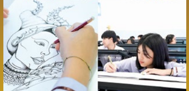
บรรยากาศการเรียนเขียนแบบ