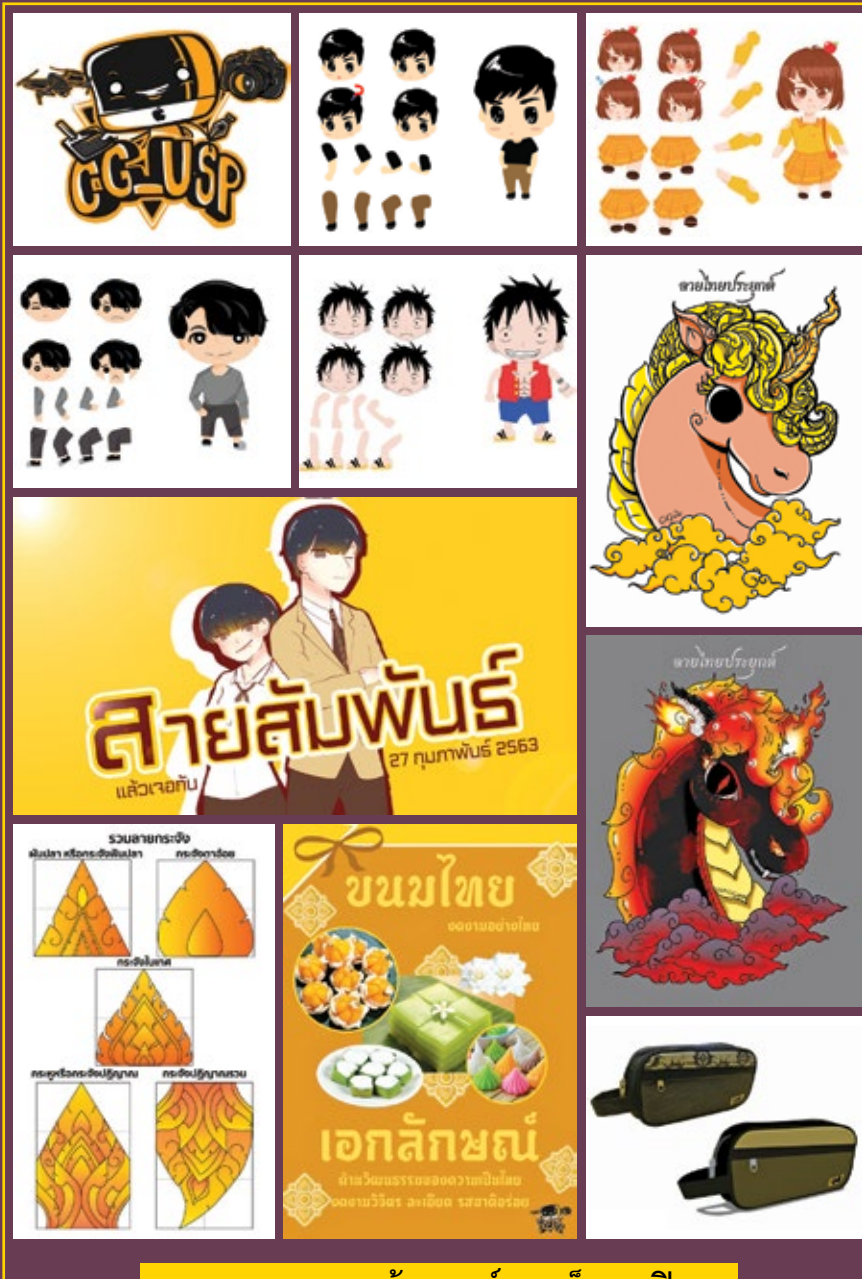
สุดยอดผลงานสร้างสรรค์ของเด็กกราฟิก