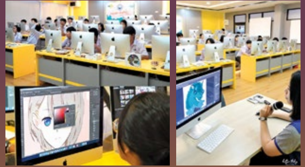
บรรยากาศการเรียนในห้องกราฟิก